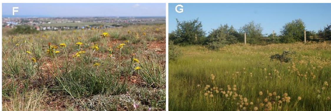
Рис. 2 Местообитания Gelasia villosa subsp. columnae (Guss.) Bartolucci, Galasso et F.Conti в окрестностях Севастополя (Крым): F – на высоте Горной; G – в Мраморной балке

Как и у себя на родине, в окрестностях Севастополя G. villosa subsp. columnae произрастает на открытых глинистых и каменистых известняковых склонах в составе ксерофитной травянистой растительности класса Festuco-Brometea Вг.-Вл. et Тх ex Соó 1947, реже – в травяном ярусе разреженных кустарниковых сообществ класса Crataego-Prunetea Тх. 1962 пом. conserv. ргopos. Вид местами встречается в большом обилии и является одним из доминантов фитоценозов, в конце весны – первой половине лета, в период цветения и плодоношения, создавая аспект (рис. 2). Численность популяций в Мраморной балке и на высоте Горной достигает нескольких тысяч особей.