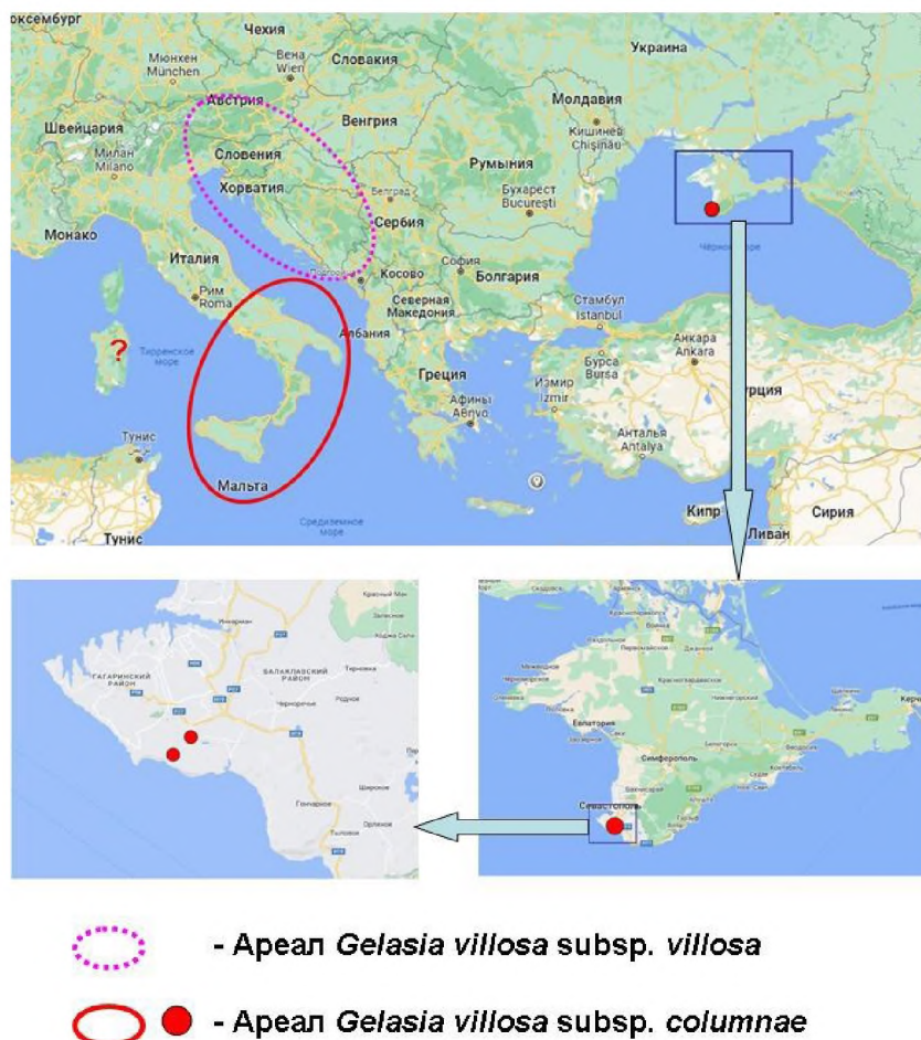
Рис. 3 Картосхема распространения Gelasia villosa Cass.

видов, приводимых для синтаксонов союза Hippocrepido glaucae-Stipion austroitalicae и порядка Scorzoneretalia villosa , не отмечен нами непосредственно в местах произрастания G. villosa , но встречается поблизости и в целом характерен для степных сообществ Гераклейского п-ва. Это свидетельствует об их значительном флористическом сходстве с ксерофитной травянистой растительностью как северо-восточного побережья Адриатики, так и Южной Италии. Поэтому неудивительно, что G. villosa нашел для себя здесь подходящее фитоценотическое окружение и полностью натурализовался (рис. 3).