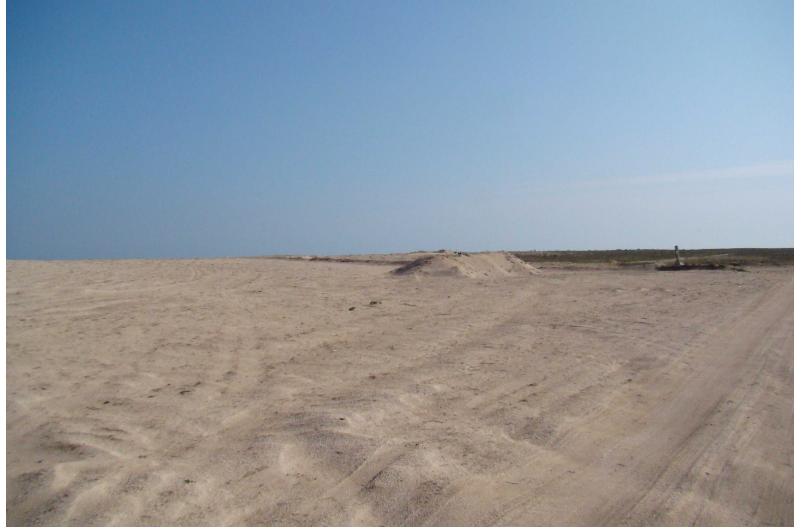
Рис. 5. Спланована під будівництво частина території (повністю знищений природний рослинний покрив)