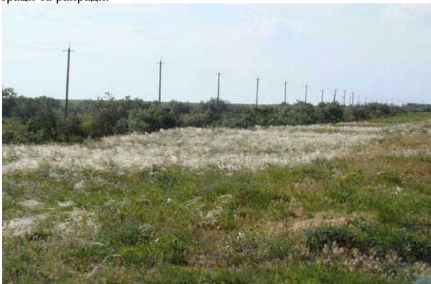
Рис. 3. Угруповання ковили дніпровської на Арабатській стрілці

Нами на цій ділянці виявлені та описані 4 рідкісних рослинних угруповання з „Зеленої книги України” – ковили дніпровської ( Stipeta borysthenicae ) (рис. 3), ефедри двоколоскової ( Ephedreta distachyae ), астрагалу дніпровського ( Astragaleta borysthenicae ) та солодки голої ( Glycyrrhizeta glabrae ). Їх площа на прилеглих територіях різко скорочується внаслідок спрямлювальних робіт та забудови під пансіонати та інші оздоровчі комплекси. Зокрема, влітку 2008 р. частину зарезервованої нами ділянки площею до 10-12 га з ковиловими угрупованнями знищили з відома Генічеської райдержадміністрації та райради.