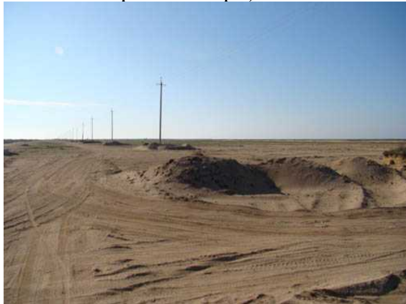
Рис. 6. Початок планування території під садово-городній кооператив «Соловейко».