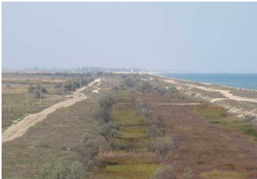
Рис. 2. Загальний вигляд пропонованої до охорони земельної ділянки

Природні і антропогенні ландшафти у сфері природокористування Наукові записки. №1. 2010. Medicago kotovii Wissjulina, Onosma borysthenica Klokov, Seseli tenderiense Kotov, Thymus littoralis Klokov et Des.-Shosn. та інших видів – представників псамофільно-літорального ендемічного причорноморського комплексу [8].