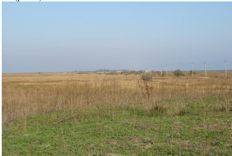
Рис. 4. Рідкісні рослинні асоціації Арабатської стрілки до планування бульдозерами

Однак, незважаючи на таку природну унікальність Арабатської стрілки, на теперішній час спостерігається інтенсивна антропогенна діяльність у її межах – забудова, планування території потужною технікою, надмірний випас худоби, стихійний відпочинок, випалювання сухої трави є загрозовою для збереження не тільки біологічного і ландшафтного різноманіття цієї території, а ставить під загрозу взагалі існування Арабатської стрілки як географічного, геологічного та ландшафтного утворення (рис. 4).