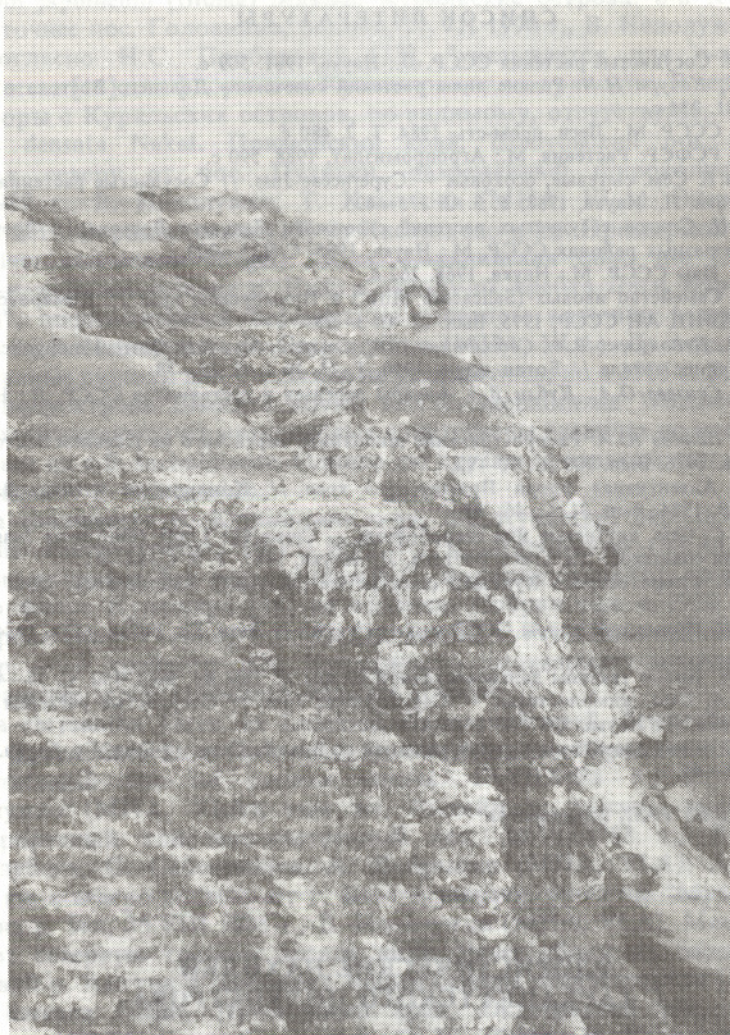
Рис. 1. Ландшафт Джангульского оползневого побережья

о том, что оползневые явления охватывают все новые участки суши. В результате этих процессов берег отступает в среднем на 0,1—0,2 м в год [1, 2].