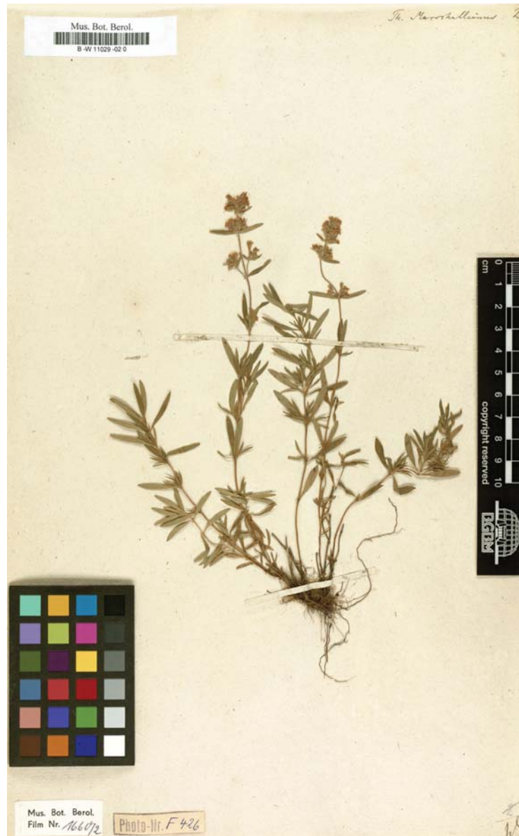
Таблица II. Лектотип Thymus marschallianus Willd. (Röpert, 2000+: http://ww2.bgbm.org/Herbarium/specimen.cfm?Barcode=BW11029020 / ImageId: 388585).